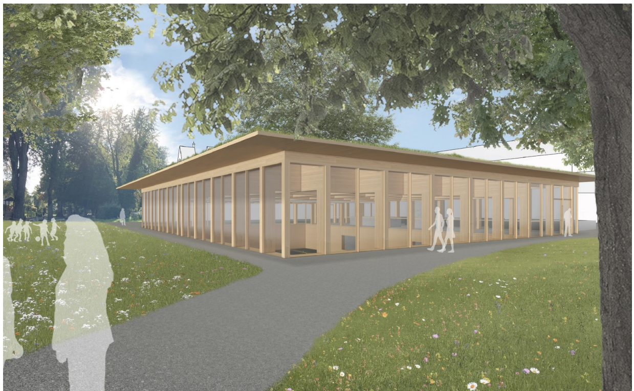
Perspektivische Darstellung von Süd-Ost (ohne Maßstab)